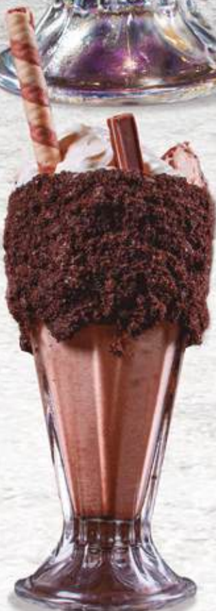
Monstruo de Chocolate