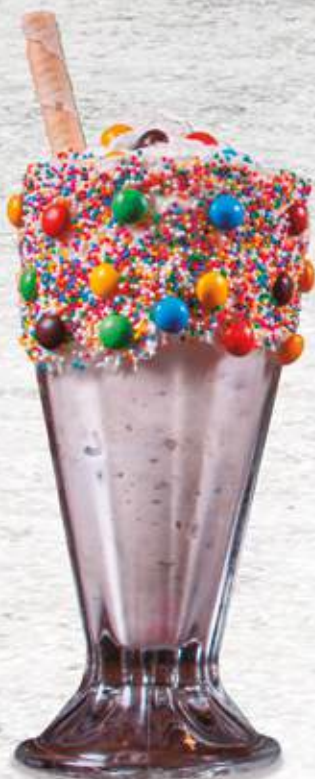
Monstruo de Vainilla