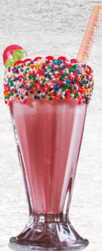
Monstruo de Fresa