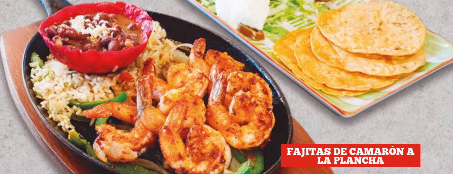
FAJITAS DE CAMARÓN A LA PLANCHA