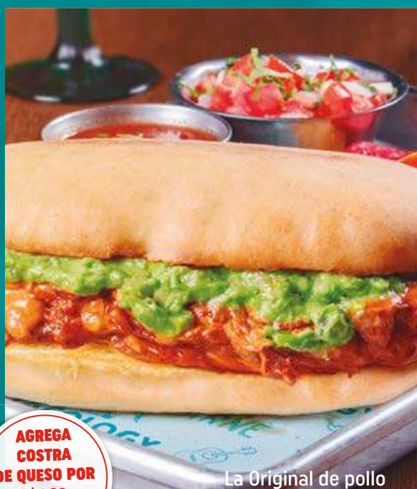
La Original de pollo

Se agrega el 10% de propina sugerida a tu factura final. Imágenes de carácter ilustrativo.