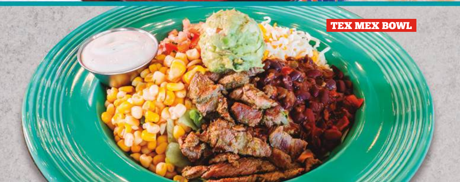
TEX MEX BOWL