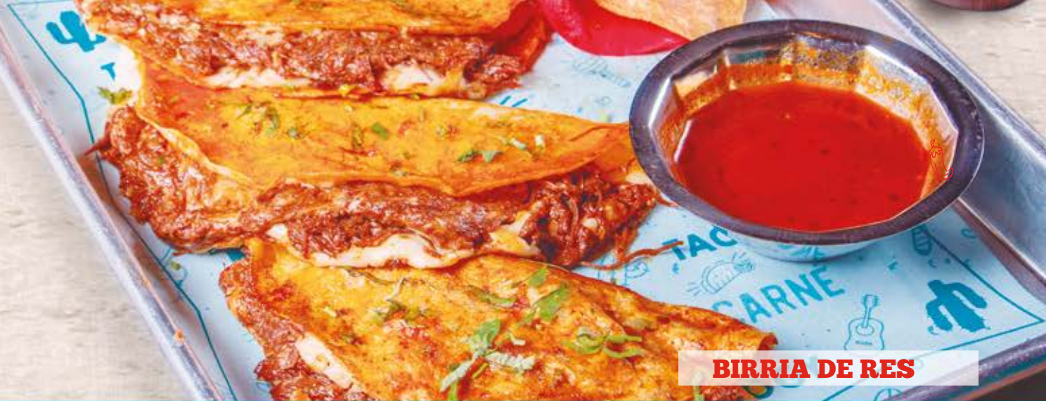
BIRRIA DE RES