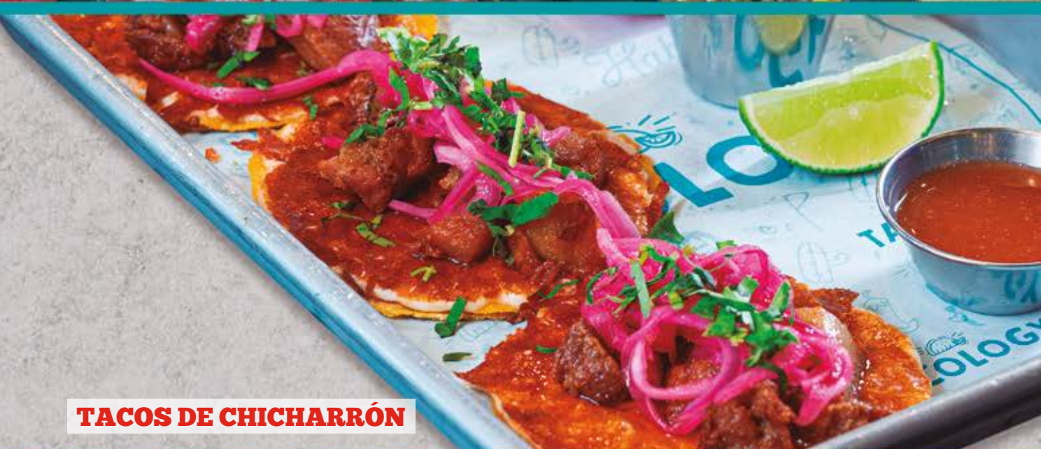
TACOS DE CHICHARRÓN