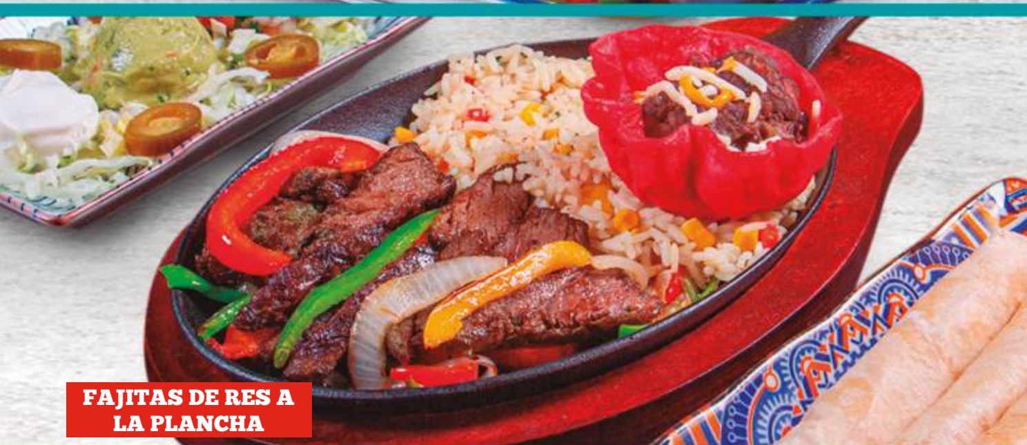
FAJITAS DE RES A LA PLANCHA