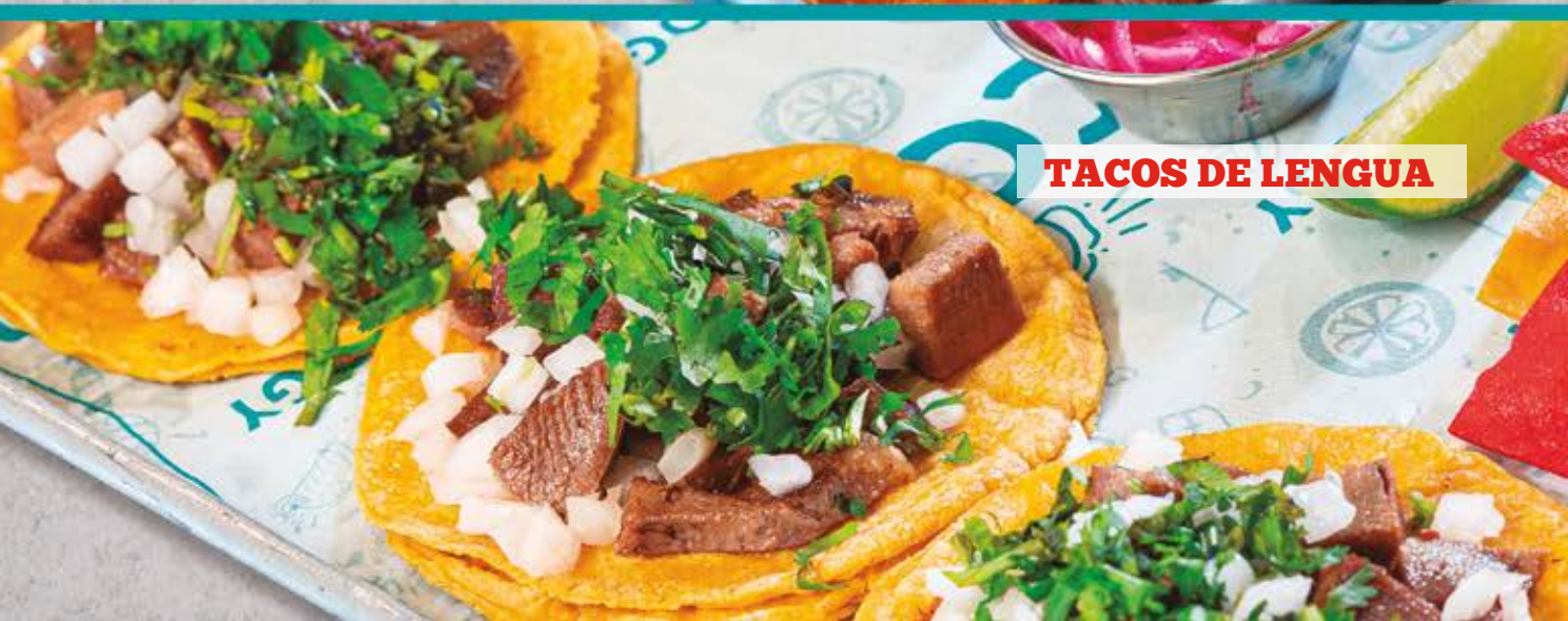
TACOS DE LENGUA