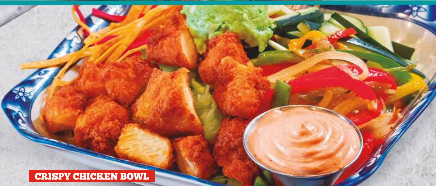
CRISPY CHICKEN BOWL