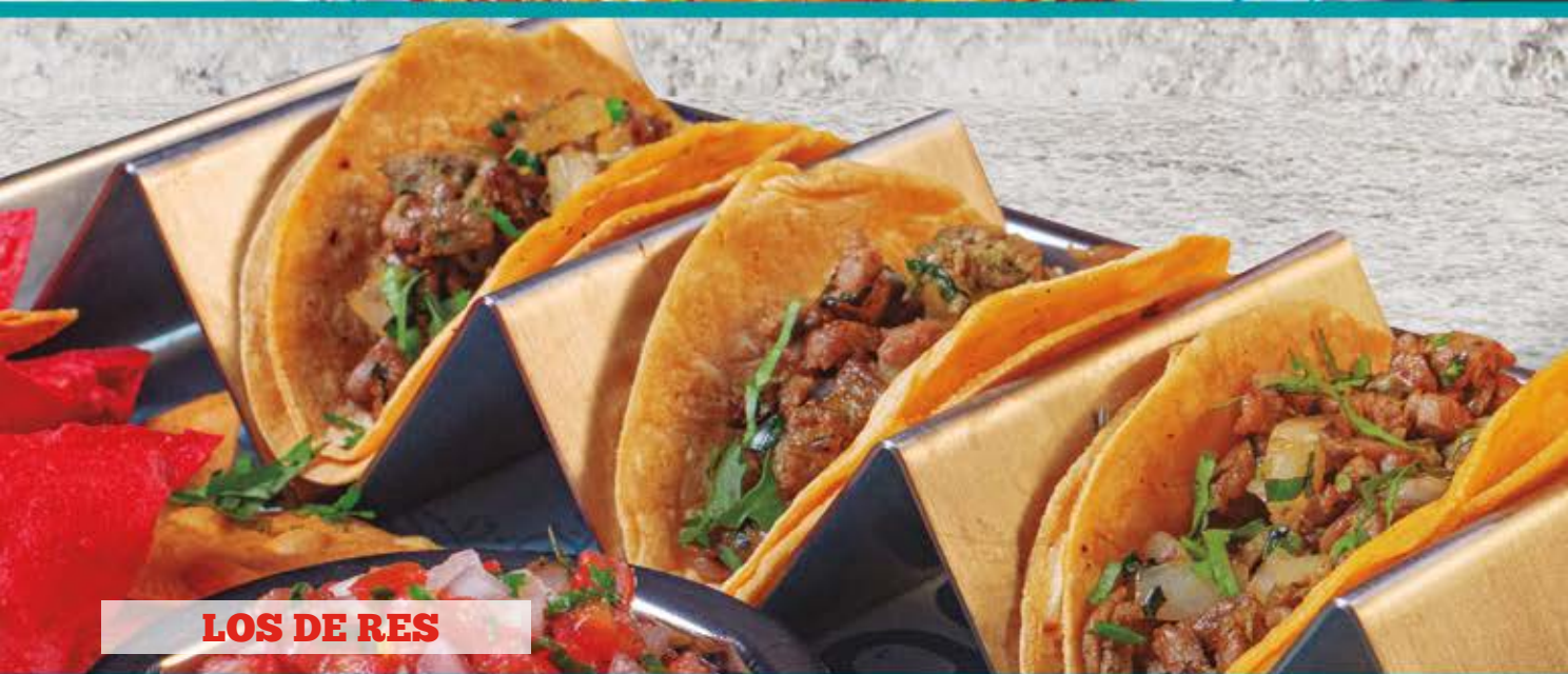
LOS DE RES