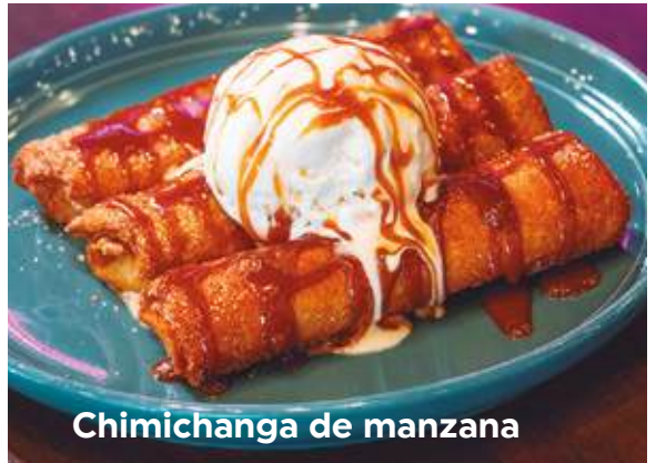
Chimichanga de manzana