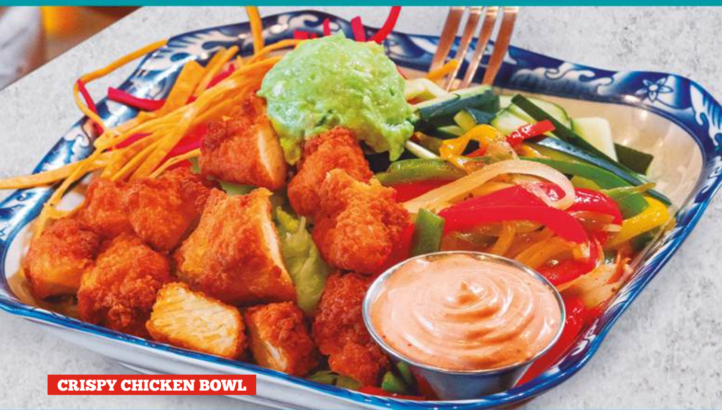
CRISPY CHICKEN BOWL