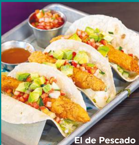
El de Pescado

¿NO TE GUSTA LO PICANTE? PIDE A TU SERVER POLLO SIN PICANTE