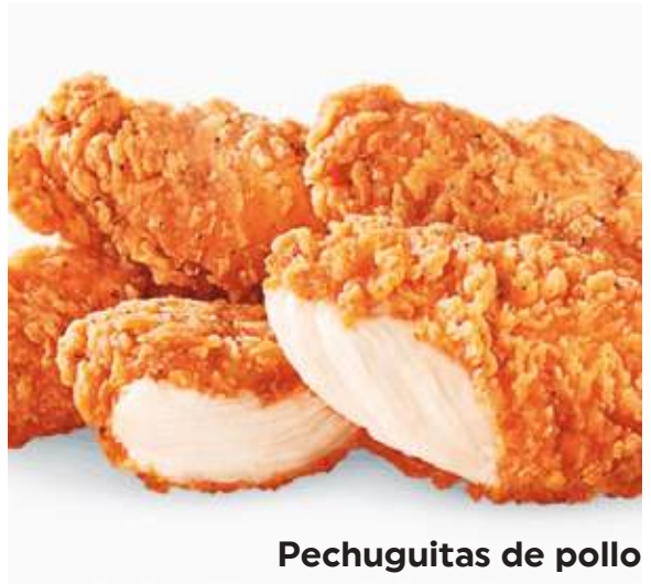
Pechuguitas de pollo

Deliciosos tacos de tu elección, perfectos para los pequeños (2 unidades). $4.99