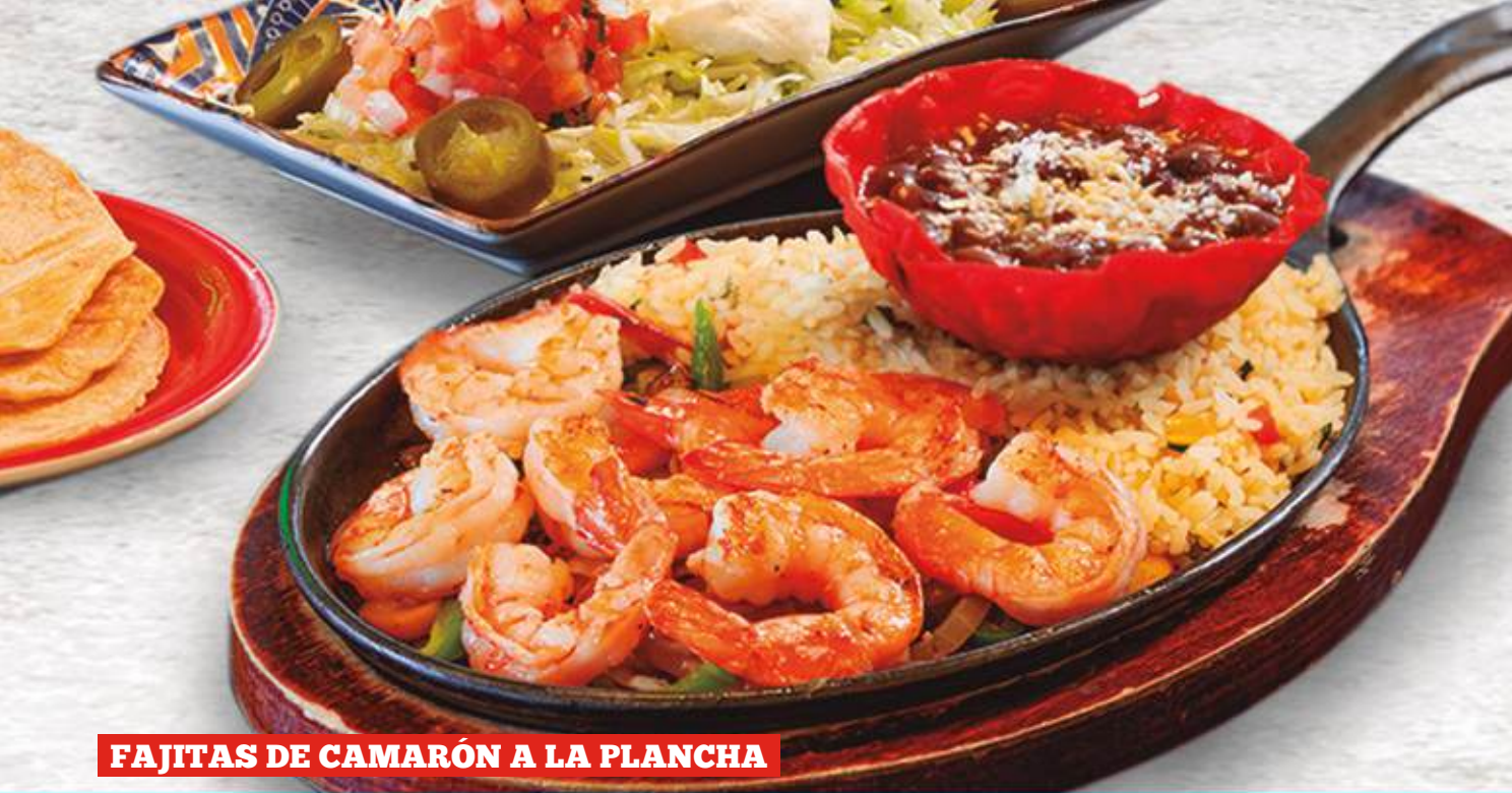
FAJITAS DE CAMARÓN A LA PLANCHA