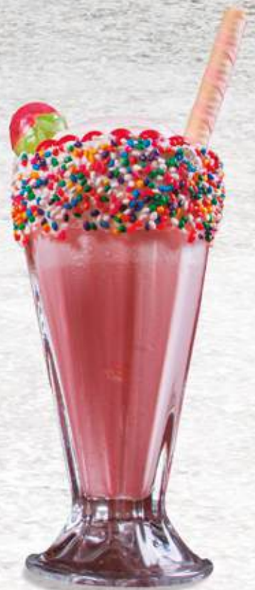
Monstruo de Fresa