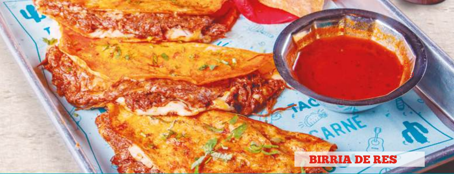
BIRRIA DE RES