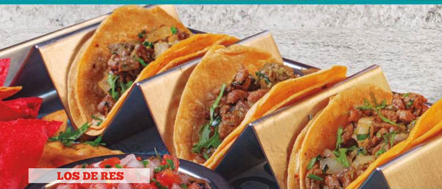
LOS DE RES