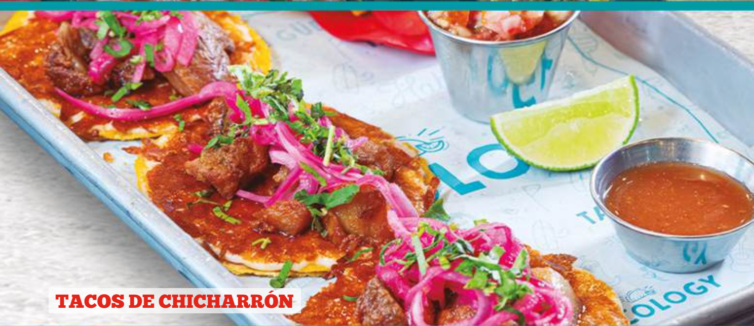
TACOS DE CHICHARRÓN