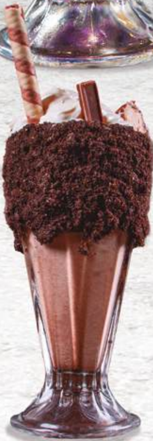
Monstruo de Chocolate