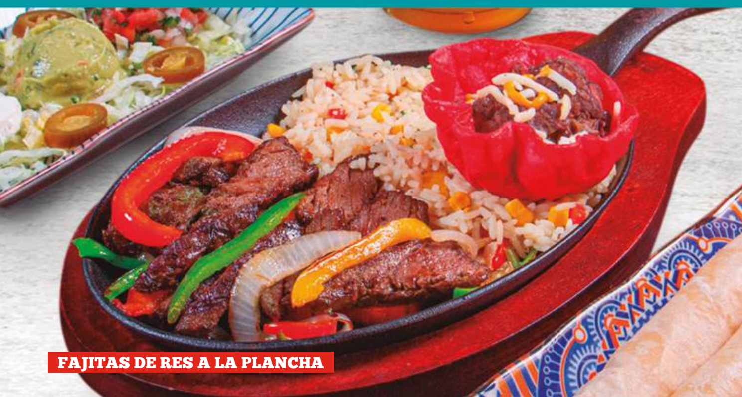
FAJITAS DE RES A LA PLANCHA