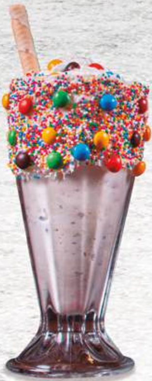
Monstruo de Vainilla