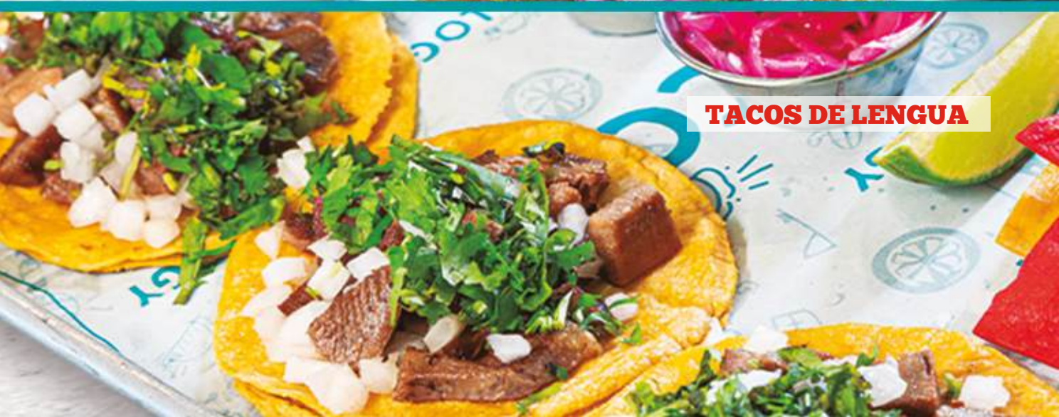
TACOS DE LENGUA