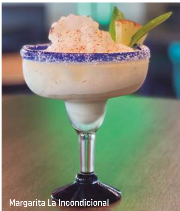
Margarita La Incondicional